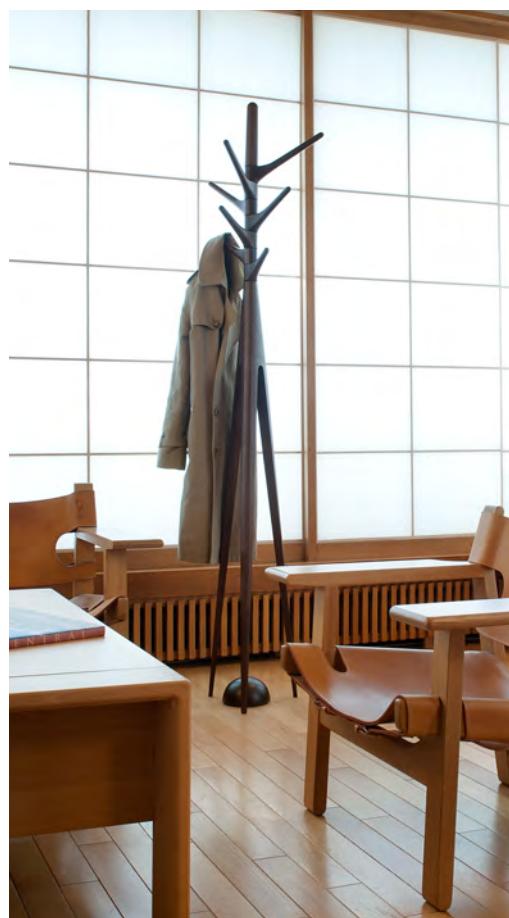
fioretto コートスタンド ¥220,000(税込)