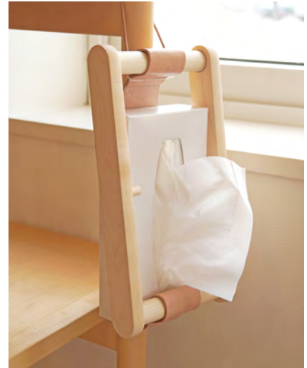
C-WORKS 掛けるティッシュホルダー ¥8,250(税込)

コサイン直営店で、材料を使いきる取り組みから生まれた新しい商品をぜひお試しください。